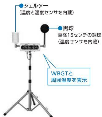
図2 WBGT測定装置 (リアルタイムでWBGTと周囲温度が表示される)